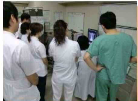
(リハスタッフと朝の検討会の様子)